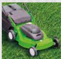
TONDEZ À RAS VOTRE PELOUSE