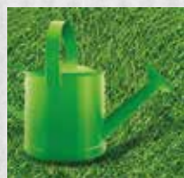
ARROSEZ APRÈS LE SEMIS

Semez régulièrement avec la boîte semoir en faisant deux passages croisés. Le premier dans le sens de la longueur, le second dans le sens de la largeur. Comptez 20 à 40g/m 2 .